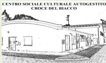
Centro Sociale Culturale "Croce del Biacco" aderente Anescaio