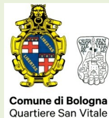
Comune di Bologna Quartiere San Vitale