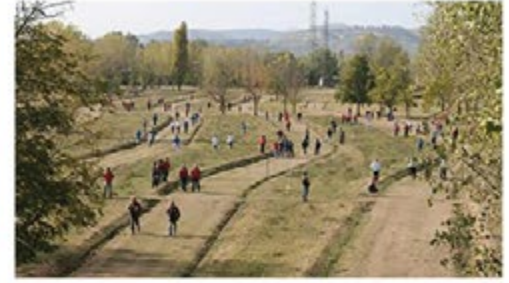
Parco Lungoreno 'La Ruzzola'