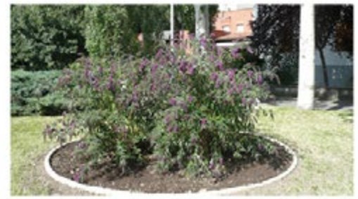
Aluola 'Las Mariposas'